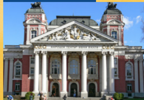
Sofia, Ivan Vazov Nemzeti Színház

Amennyiben a fenti, általános tájékoztató elolvasása után még további, konkrét kérdései lennének, forduljon hozzánk bizalommal: