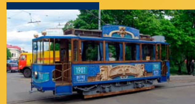
Retro villamos Rigában

További információ: http://www.autoosta.lv/