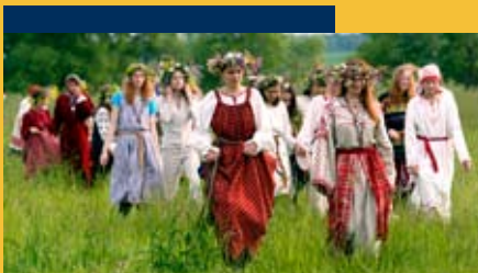
Szent Iván napja