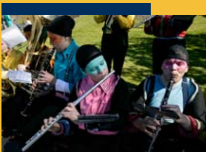
Izland nemzeti ünnepén

Hivatalos név: Izlandi Köztársaság Elhelyezkedés: Észak-Atlanti Óceán Terület: 103 000 km 2 Népesség: 320 169 fő Főváros: Reykjavik Államforma: köztársaság Hivatalos nyelv: izlandi Hivatalos fizetőeszköz: izlandi korona Vallás: evangélikus Időzóna: Nyugat-európai idő (WET) Hívószám: +354