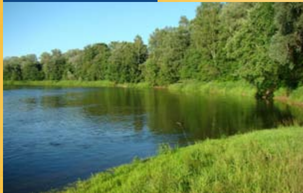
Gauja Nemzeti Park

Tartózkodási engedélyre van szüksége minden olyan EU állampolgárnak, aki három hónapnál hosszabb időt szeretne Lettországban tölteni. A szükséges nyomtatványt az illetékes Bevándorlási és Migrációs Irodánál kell beszerezni.