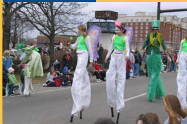
Szent Patrik napja

Hivatalos név: Ír Köztársaság Elhelyezkedés: Nyugat-Európa Terület: 70 280 km 2 Népesség: 4 156 119 fő Főváros: Dublin Államforma: köztársaság, parlamentáris demokrácia Hivatalos nyelv: angol, ír Hivatalos fizetőeszköz: euró (1 € = kb. 280 HUF) Vallás: római katolikus, anglikán, egyéb Időzóna: közép-európai idő (CET) -1 óra Hívószám: +353