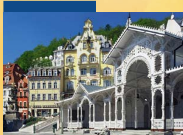
Karlovy Vary, Karlsbad